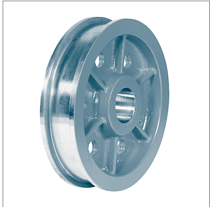
Laufkörper A 630 × 110 (breite Ausführung)

Bezeichnung eines Laufkörpers mit Nenn- \varnothing d_1 = 400 mm, Spurbreite b_2 = 80 mm, Bohrungs- \varnothing d_3 = 105 H7, mit Passfedernut nach DIN 6885-1: