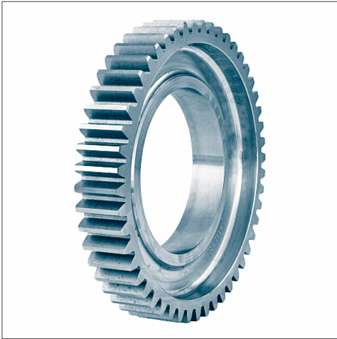
Zentrier- \varnothing d_1 \leq 250 mm