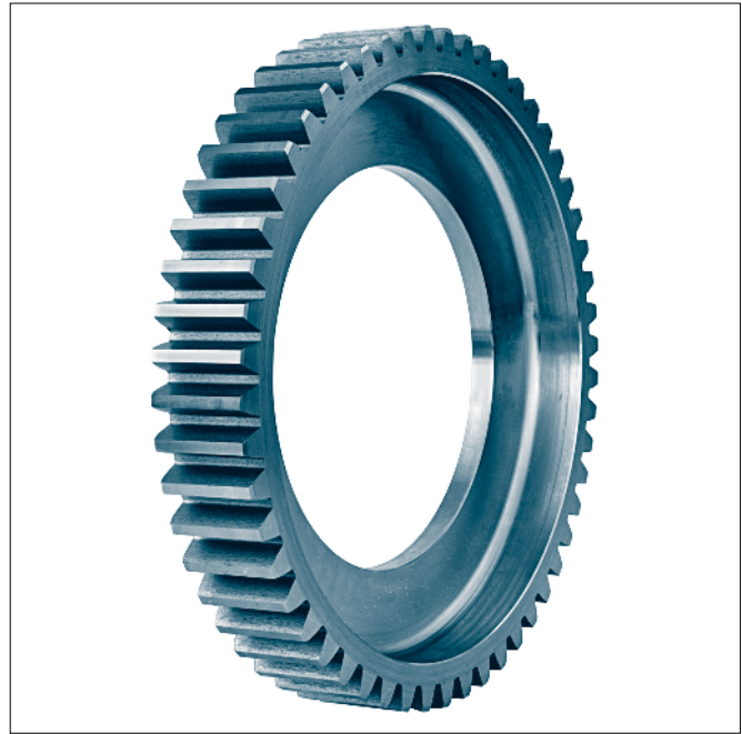
Zentrier- \varnothing d_1 \geq 470 mm

Bezeichnung eines Zahnkranzes mit Zentrier- \varnothing d_1 = 530 mm, Zähnezahl 62: